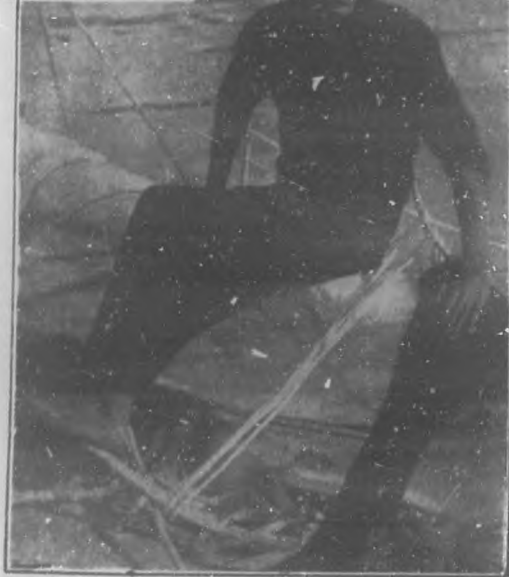
El aviator francés Alain J. Gerbault que ha cruzado el océano Atlántico en un bote de treinta pies, tardando ciento cuarenta y dos días en la travesía.

Alin Gerbault, el famoso marino y aviador francés, que atravesó hace poco el Atlántico, sólo y en un pequeño barco de vela, ha sido nombrado caballero de la Legión de Honor, partiendo en estos días de los Estados Unidos para su patria, en busca de la preciada recompensa a su heroísmo.