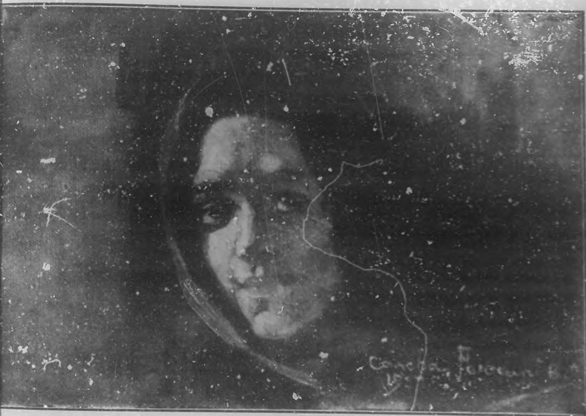
CABEZA DE ESTUDIO Oleo por Concha Ferrant B. S.