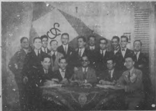
LA DIRECTIVA DEL "CLUB SMART" — Simpatícos y prestigiosos jóvenes que forman la Junta Directiva del progresista club "Smart".