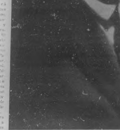
COMM. TITTA RUFFO

Y ahora, para dar una idea a nuestros lectores de la finalidad de esa "tourné", la más importante tal vez de las celebradas hasta la fecha por países americanos de origen latino, vamos a reproducir las declaraciones hechas por la empresa organizadora de la misma, lo que vendrá a ser el breve brochure que acompaña esta crónica.