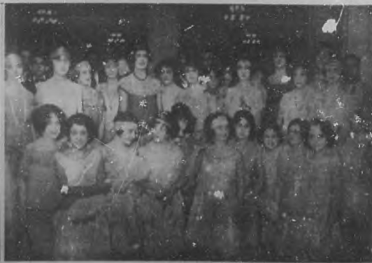
EN EL "MIDDAY CLUB" —Grupo de bellas y graciosas damitas concurrentes al baile ofrecido por los empleados del "Banco del Canadá", en el "Midday Club".