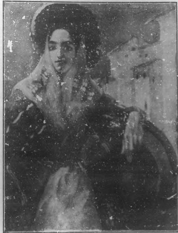
PAYESA IBICIANA Oleo por Concha Ferrant B. S.

Cuando escribió la interviu daba para ocupar tres páginas de la revista donde trabajaba.